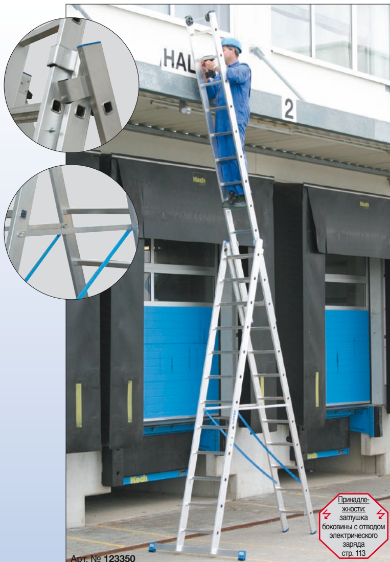
Арт. № 123350

Для этой лестницы подходят: CombiSystem 1, 2, 3, 4, 5, 6, 8